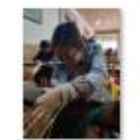
“双师型”教师培训照片9