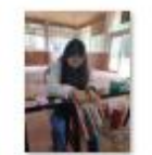
“双师型”教师培训照片17