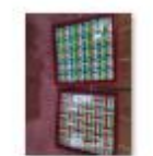
“双师型”教师培训照片26