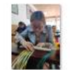
“双师型”教师培训照片10