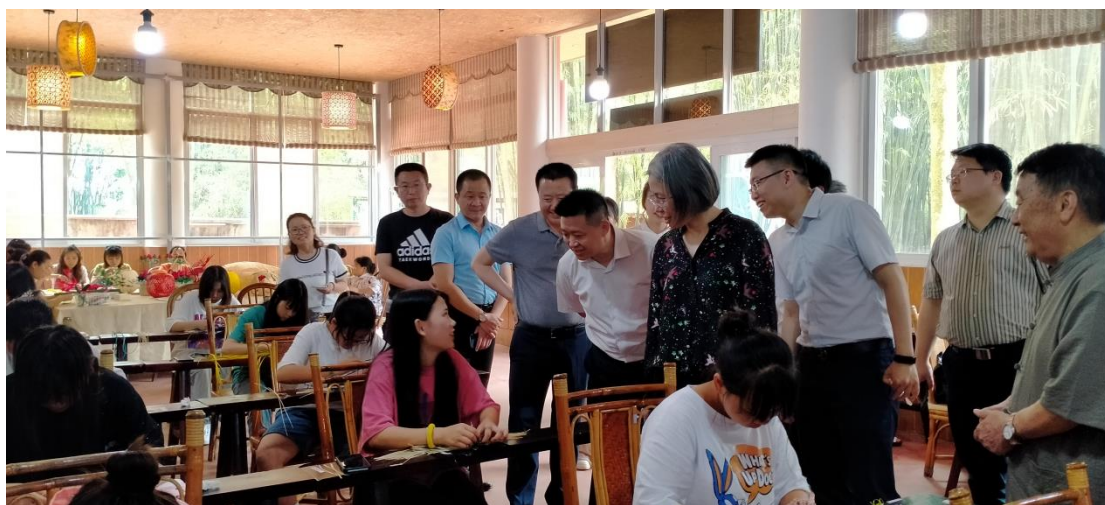
2020年6月，团中央书记处常务书记汪鸿雁莅临我校校外竹编实训基地