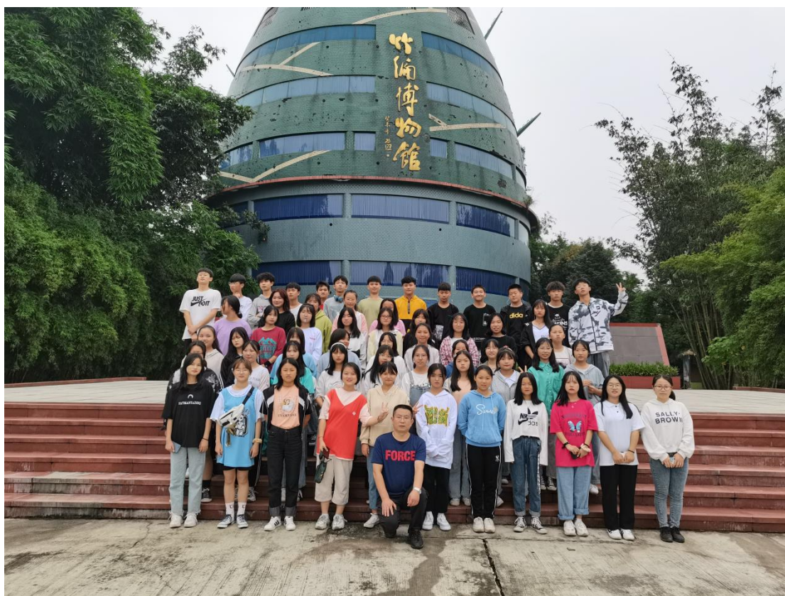
2020年9月，2020级竹编专业学生参观我校校外实训基地竹编博物馆