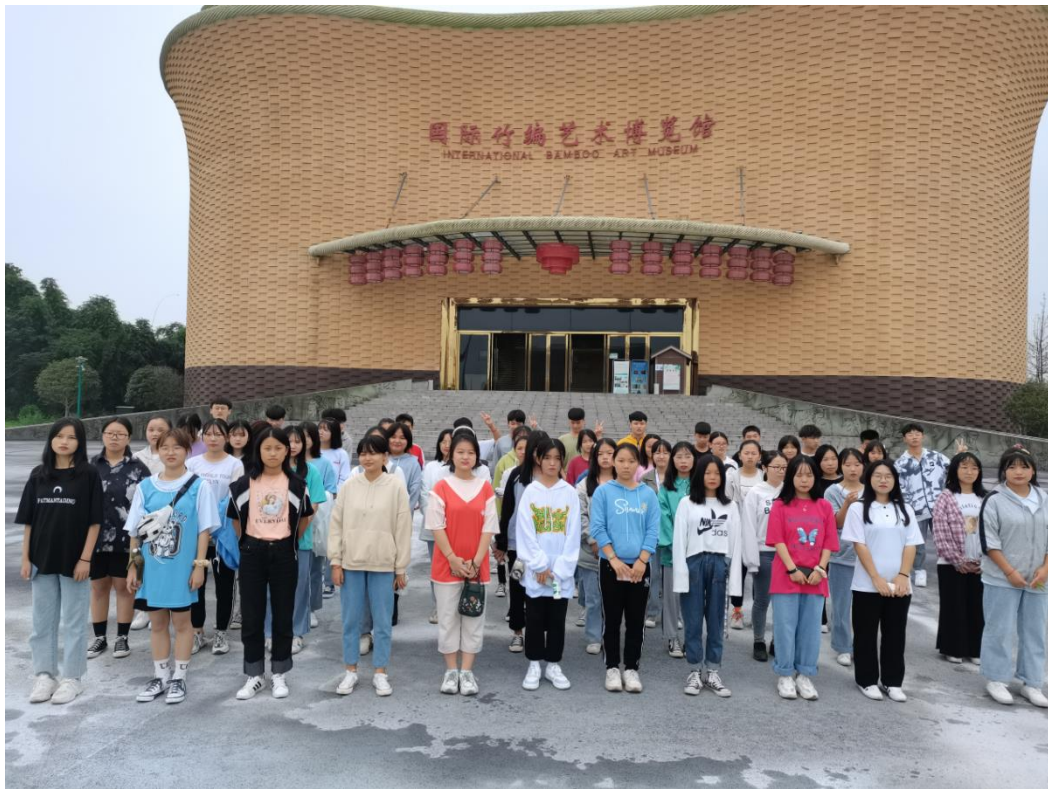
2020 年 9 月， 2020 级竹编专业学生参观我县国际竹编艺术博览馆