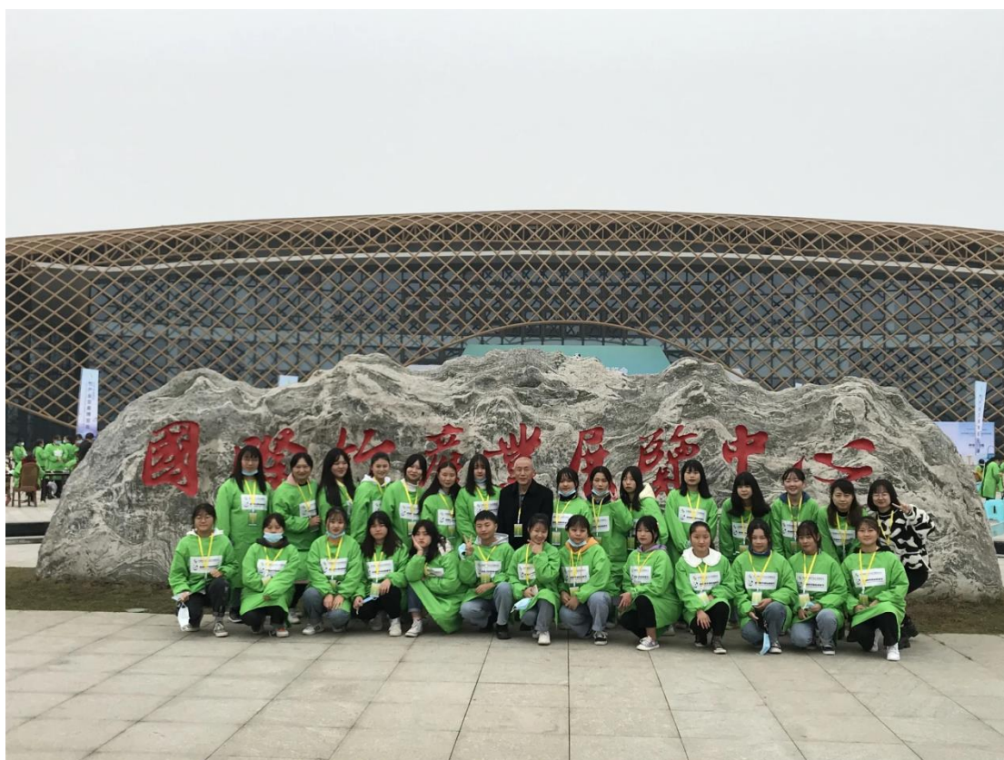
2020 年 11 月，我校竹编专业学生参与国际竹产业交易博览会现场竹编展示