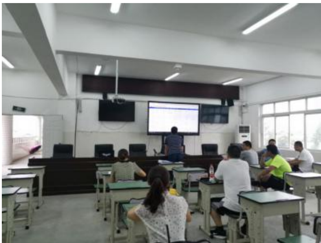
二次开发功能培训以及资源库功能确认