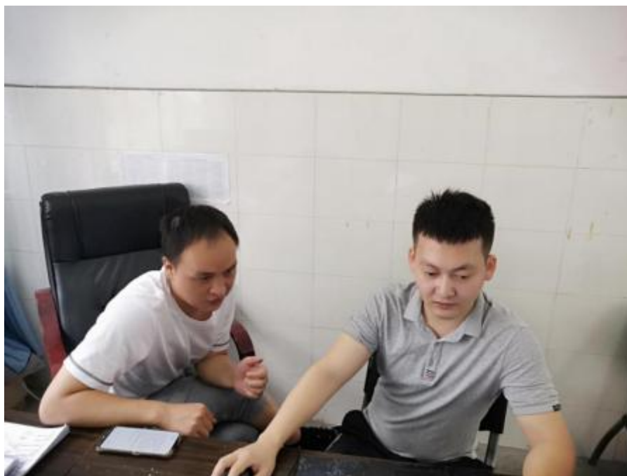
政教处质量评价体系培训