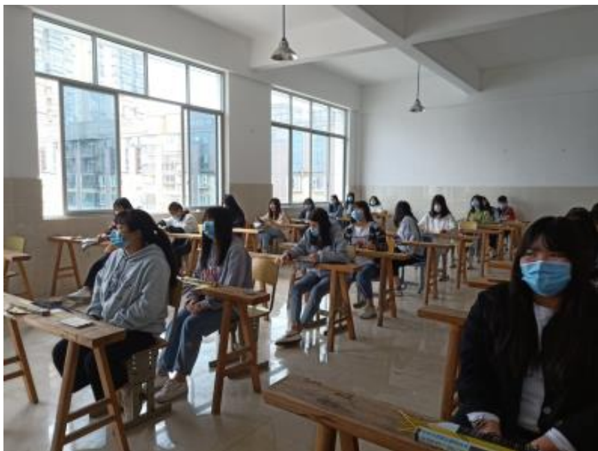
平面竹编实训室教学

各实训室教学设施齐备，包括条凳、桌椅、压铁，教学材料及学生用具准备充分，4月22日，我校两个竹编班已开始进入实训。