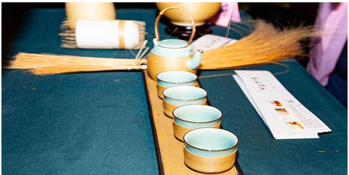
青神竹编艺术品

国际在线四川消息（方秦）：“青神成功让本地特色产品进入国际市场，我认为此举值得阿拉伯借鉴。”迪拜中阿卫视记者康恩中在眉山市洪雅县柳江古镇观看青神竹编编制时说道。